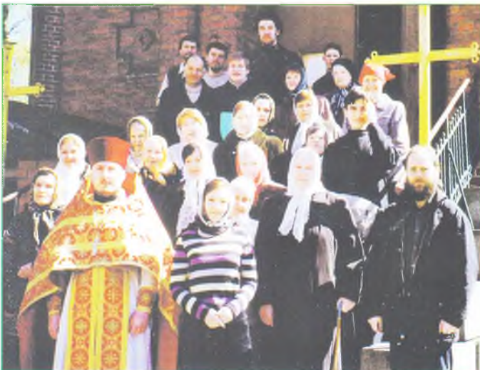
После воскресного богослужения в храме Всех Святых.