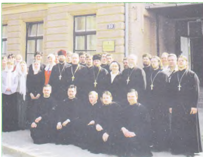
Выпуск 2006 года.