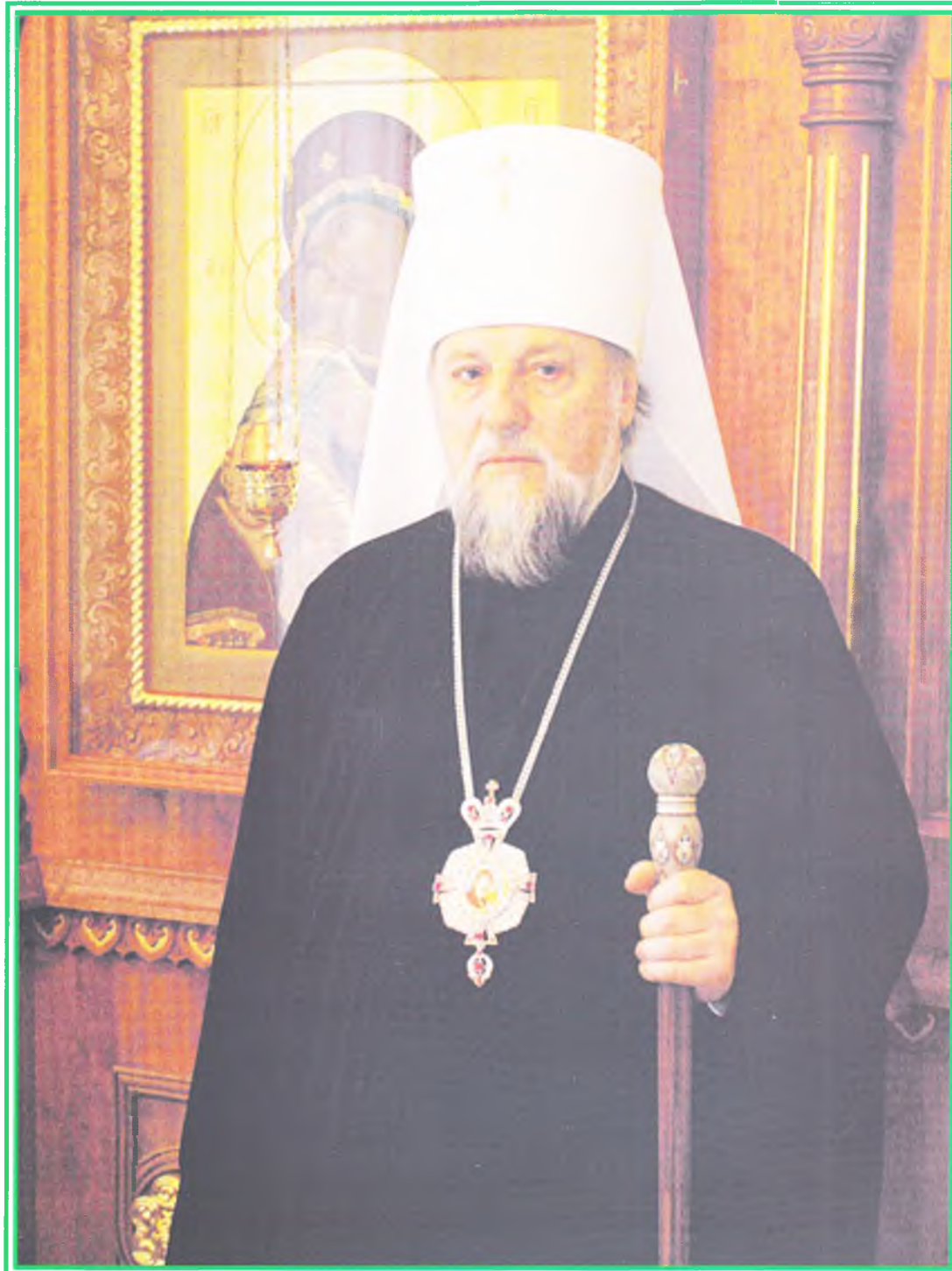
Его Высокопреосвященство, Высокопреосвященнейший Александр, Митрополит Рижский и всея Латвии, ректор Рижской Духовной семинарии