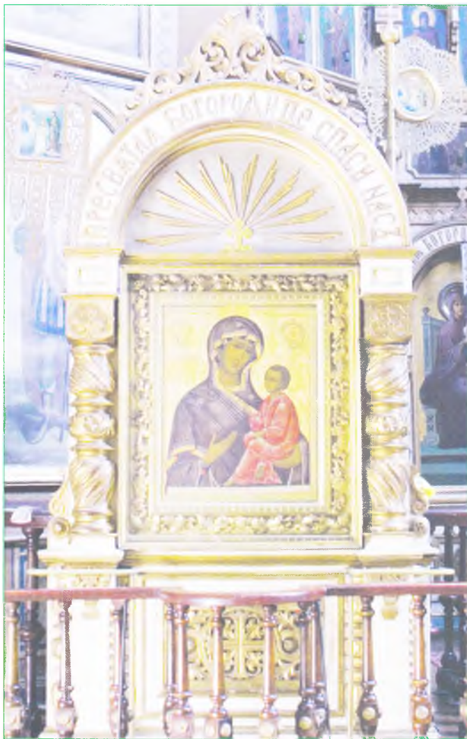
Чтимая Тихвинская икона Пресвятой Богородицы в семинарском храме Всех Святых.