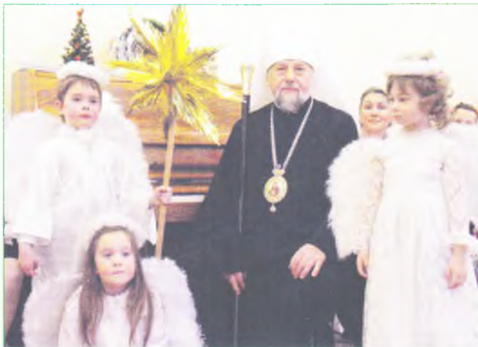
На Архиерейской Рождественской елке дети воскресной школы кафедрального собора.