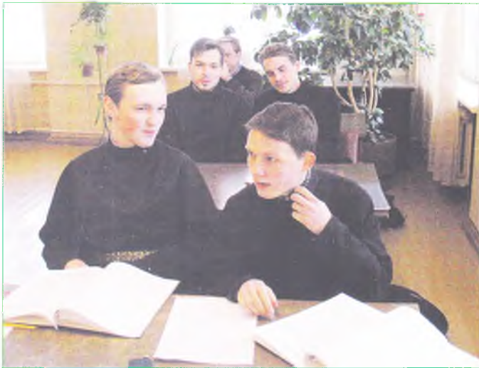
Во время занятий в РДС.