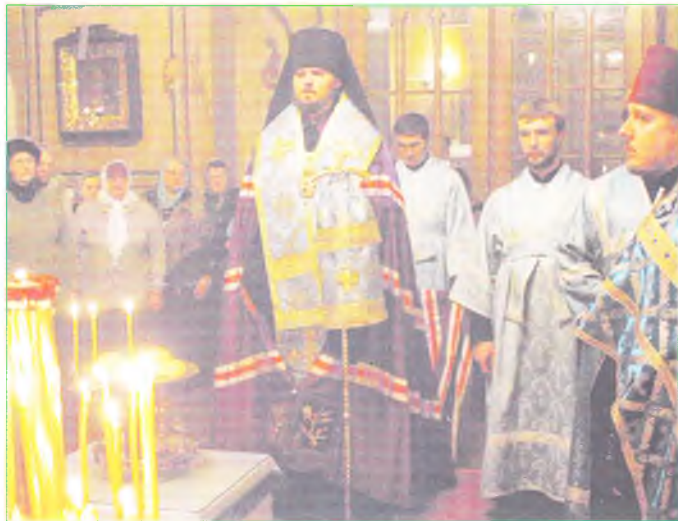
Архиерейское богослужение в храме Всех Святых.