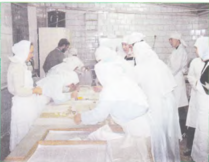
На послушании в просфорне Спасо-Преображенской пустыни.