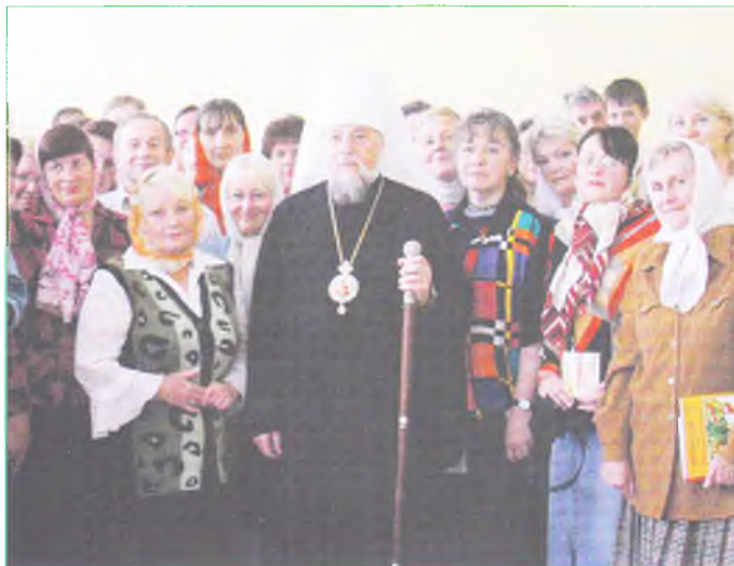
Встреча православных учителей с Архипастырем.