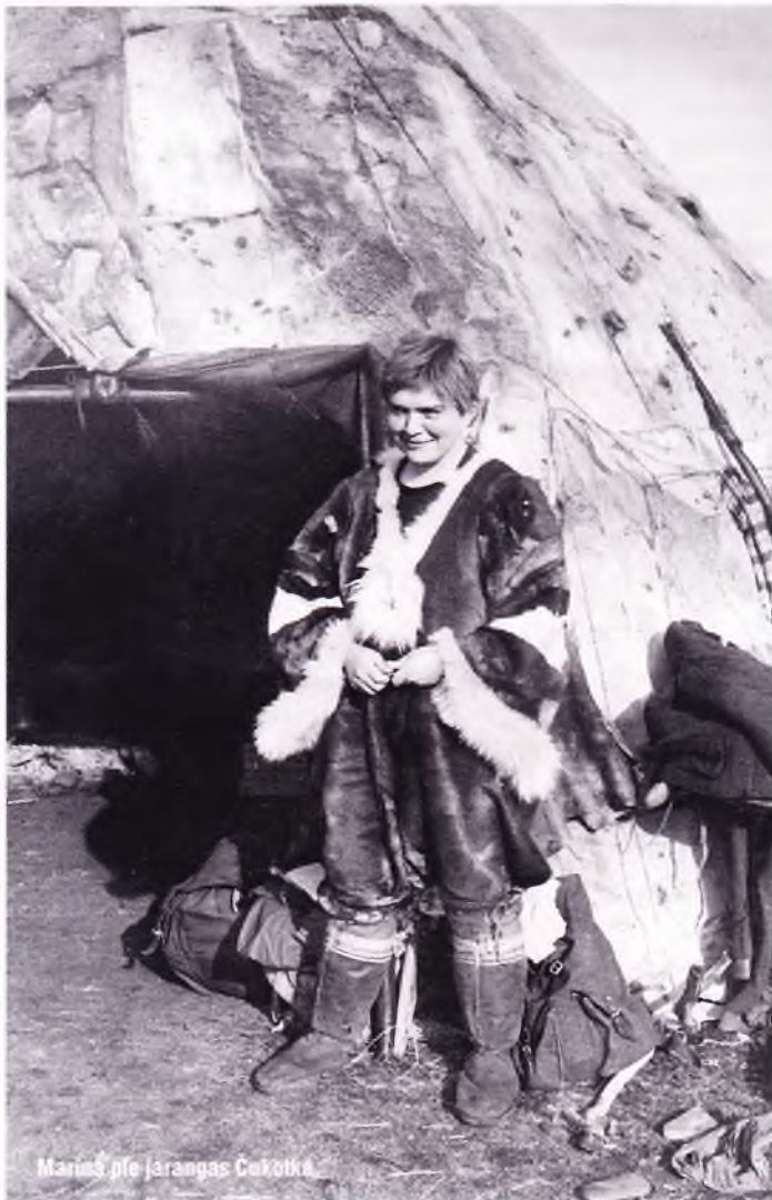
Marina pie Jarangas Čukotkā

«Tundra man iemācīja to, ko pēc tam izmantoju visu mūžu – līdzietību, cēlumu, tikumības likumus. Kad