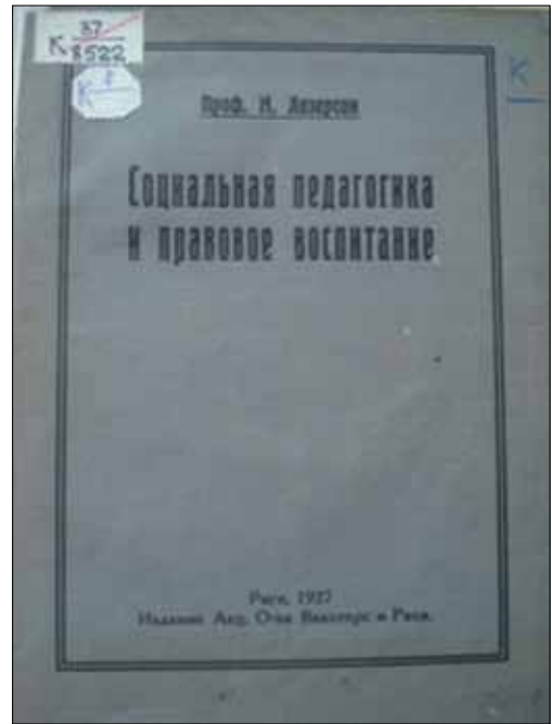
М. Лазерсон. Социальная педагогика и правовое воспитание. Рига, 1927 г.

Вхождение Лазерсона в политические реалии России в 1917 г. заставило его привнести новые повороты в психолого-правовую теорию Петражицкого, использовать в политико-правовом контексте, контексте социальной педагогики. В этой связи хочется перечислить несколько его работ, изданных в Петрограде и Москве на русском языке: «Война и международная политика» (1917), «К международной постановке еврейского вопроса» («Основные начала организации пропорциональных выборов в Бельгии» (1917)), «Автономия и федерация» (1917), «Национальность и государственный строй (Юридикополитический очерк)» (1918), «Право, правизна и трудовой процесс. Опыт социолого-лингвистического объяснения понятия права» (1919). Вспомним его работу «Социальная педагогика и правовое воспитание. Проф. Л.И. Петражицкому – к 35-летию его научной деятельности» (Рига, 1927). Тему социальной педагогики и политики права в монографии: Лазерсон М. Общая теория права. Введение в изучение права. С. 349–369. К тому же молодой ученый проявил неподдельный интерес к экспериментально-психологическим методам, углублялся в проблемы языка – языка как массового опыта и его прямого отражения в праве, осмысливал взаимодействие между позитивным (положительным) и естественным правом.